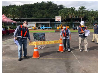
土石流發生，巡視預警組架設封鎖線