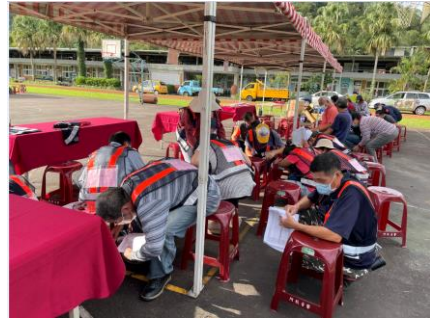
進行地震防護「趴下、掩護、穩住」