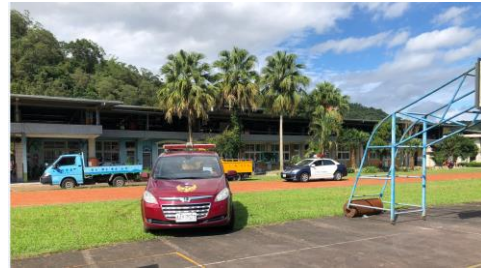
消防隊災防車協助廣播