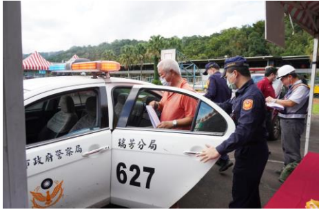
通報疏散組及警員前往撤離里民