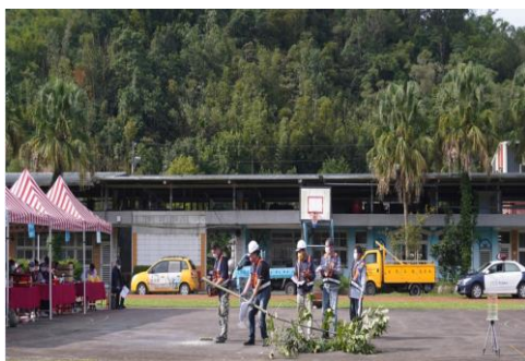
整備搶救組協助鋸斷路倒樹木