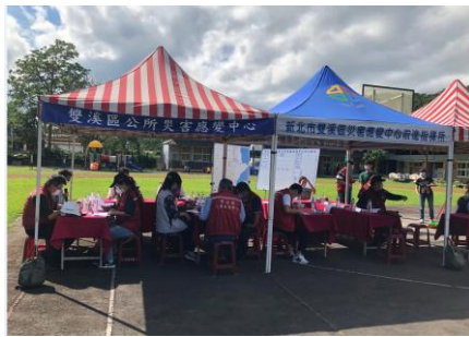
應變中心、前進指揮所開設