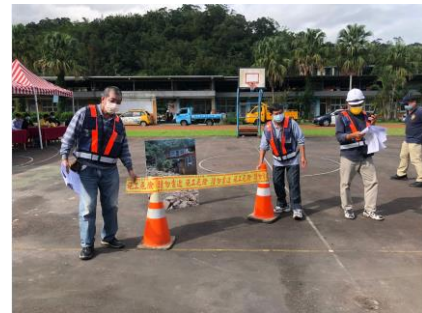
行政後勤組於收容所宣達事項