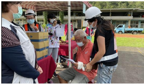
關懷救護組關心受傷里民並協助包紮