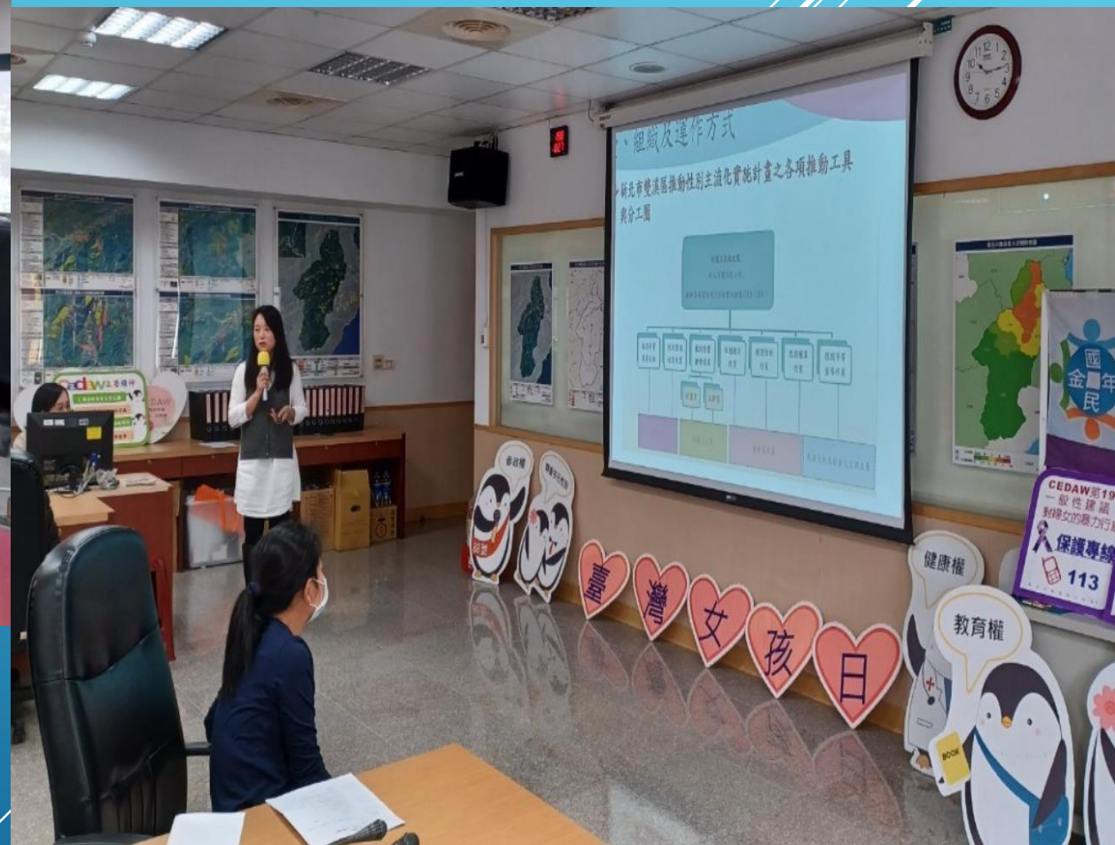
新北市雙溪區公所 性別平等小組113年第1次工作會議