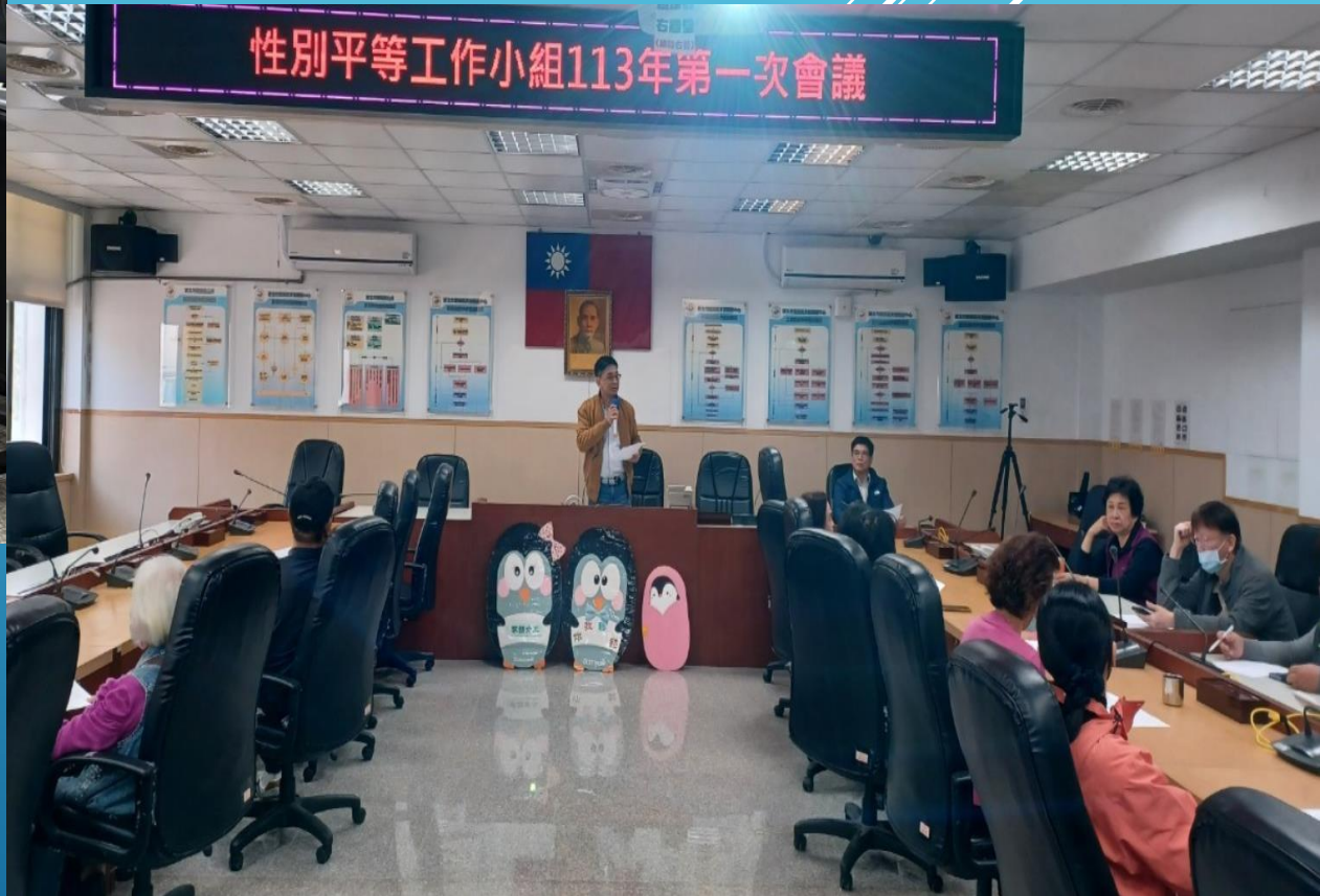
新北市雙溪區公所 性別平等小組113年第1次工作會議