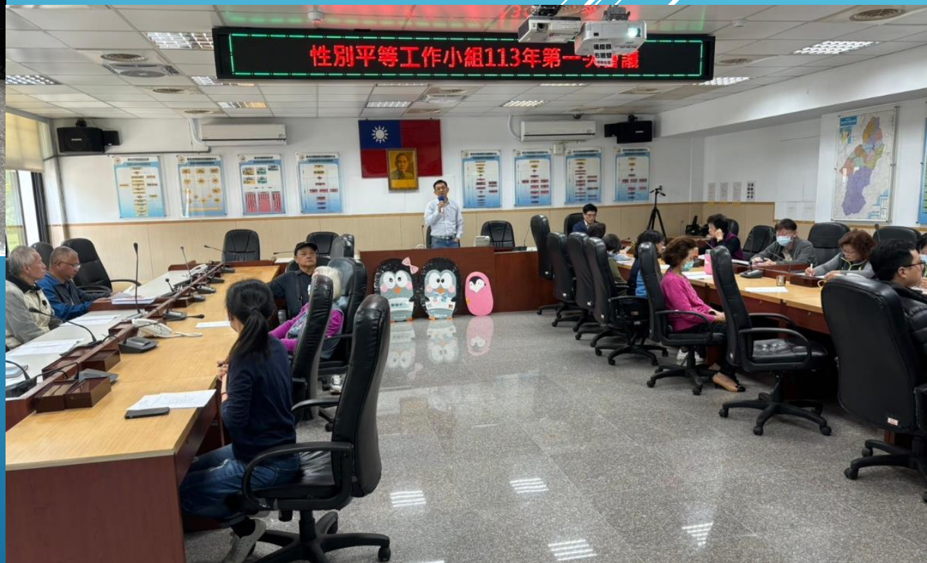
新北市雙溪區公所 性別平等小組113年第1次工作會議