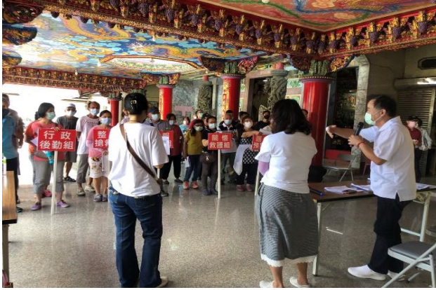
第 2 次預演(區長致詞)