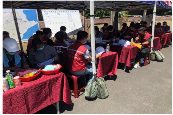
第 3 次預正式演練